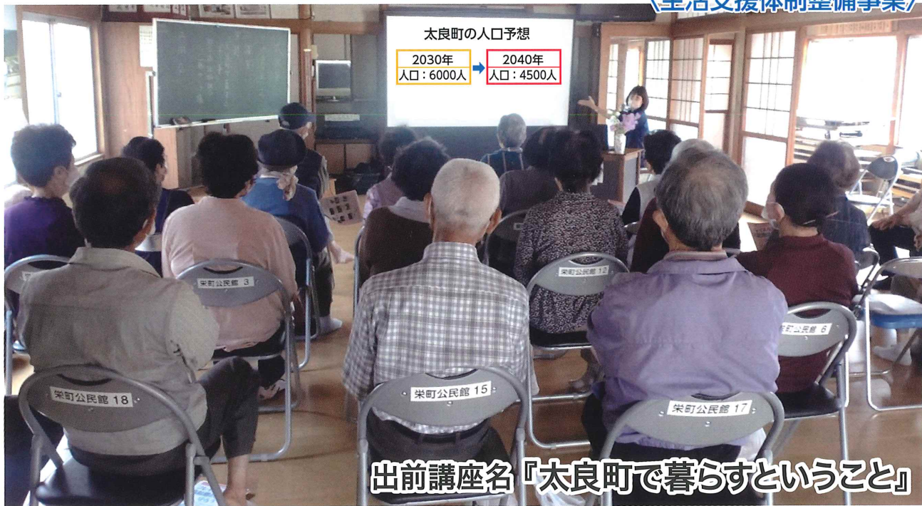
出前講座名『太良町で暮らすということ』

太良町社会福祉協議会では、急激に少子高齢化が進行している太良町で、今後どのような事態が起きるのか、私たちの暮らしはどう変わっていくのかという予測を示しながら、町全体で取り組むべき介護予防活動の重要性を説明し、どうすれば自分が望む生活を継続できるのかを考えてもらうために出前講座を行っています。