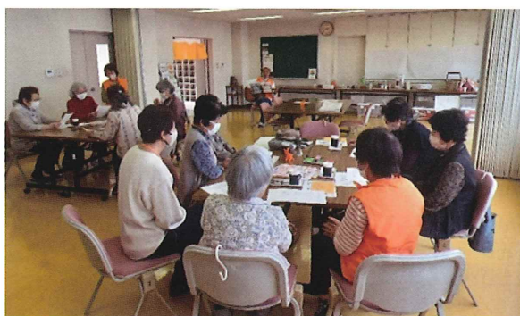
多良会場の様子（太良高校豊峯会館）