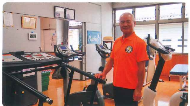
〈 しおさい館のトレーニング室受付 〉