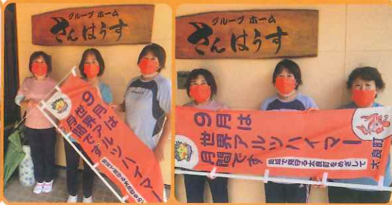
グループホームさんほうす