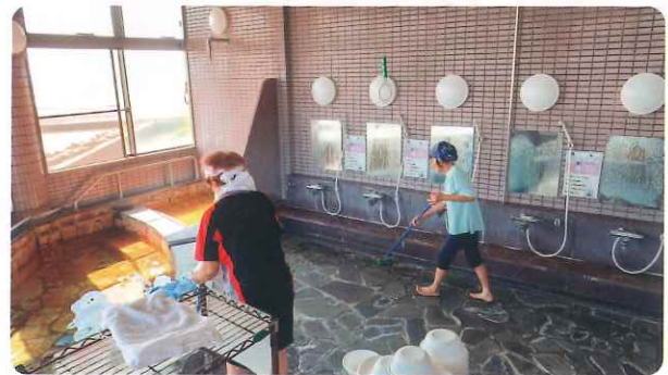
〈 しおさい館の清掃作業 〉