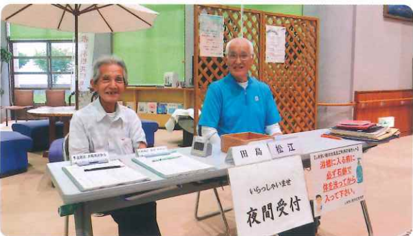
〈 しおさい館の夜間受付 〉