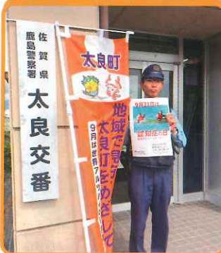
鹿島警察署太良交番