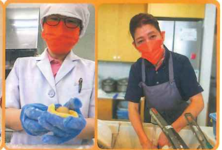
グループホームふるさとの森