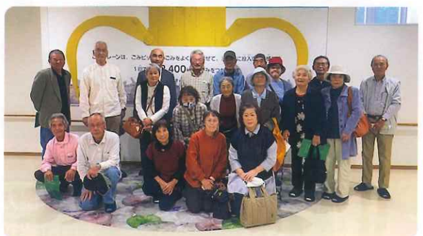
〈 シルバー人材センター交流会 〉