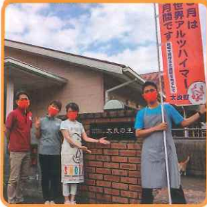
グループホーム太良の里