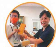
認知症サポーター 太良町登録者 1000人達成