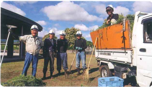
〈 町内各所の剪定と除草作業 〉