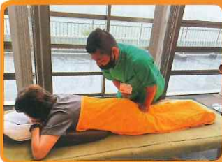
くすりのマース様