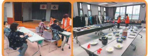
介護予防ミニ講座 家庭内不用品バザー