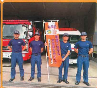
鹿島消防署太良分署