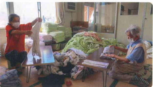
〈 光風荘の洗濯物畳み作業 〉