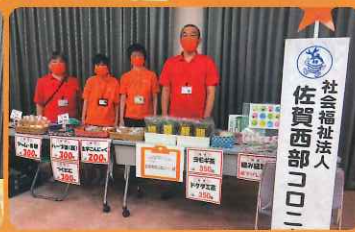
佐賀西部コロニー様