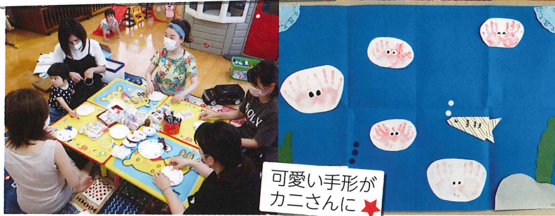
可愛い手形がカニさんに★