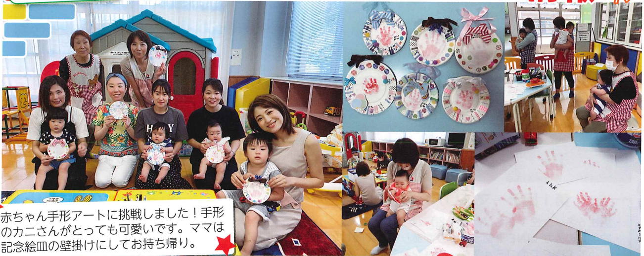
★赤ちゃん手形アートに挑戦しました！手形のカニさんがとっても可愛いです。ママは記念絵皿の壁掛けにしてお持ち帰り。★