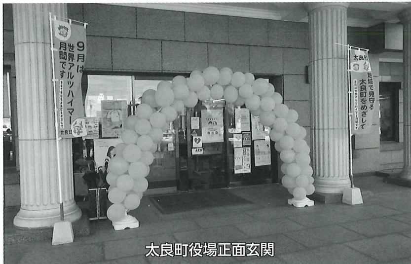
太良町役場正面玄関

昨年の9月1日から1カ月間、太良町役場の夜間オレンジライトアップや役場正面玄関としおさい館玄関ホールにオレンジバルーンアーチを設置して『世界アルツハイマー月間』のPR活動を行いました。また、町内たくさんの事業所にもオレンジ色の上り旗やステッカーの設置をご協力いただき、町民の皆さまへ広く認知症支援の必要性についてご理解いただけたと思います。