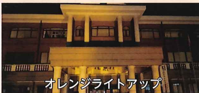
オレンジライトアップ