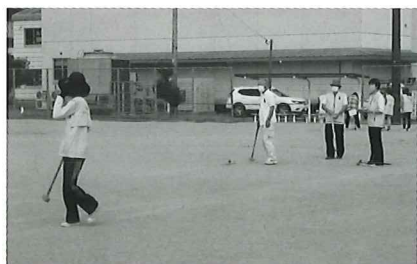
赤い羽根グランドゴルフ大会