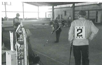
赤い羽根ゲートボール大会