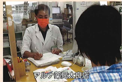
アルナ薬局太良店