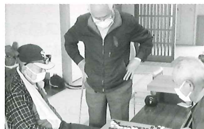
赤い羽根囲碁大会