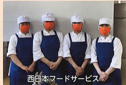
西日本フードサービス