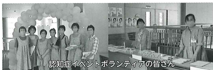
認知症イベントボランティアの皆さん

9月21日(火)の『世界アルツハイマーデー』には、しおさい館で認知症の啓発イベントを開催しました。認知症サポーター養成講座や、認知症をテーマにしたビデオの鑑賞会など総勢83名の方々に参加して頂きました。ありがとうございました。