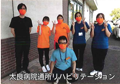
太良病院通所リハビリテーション

認知症支援のイメージカラー（オレンジ色）のマスク着用や上り旗の設置などにご協力いただきありがとうございます。一部をご紹介します。