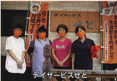
デイサービスせと