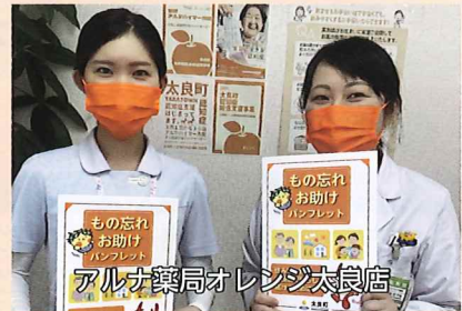
アルナ薬局オレンジ太良店