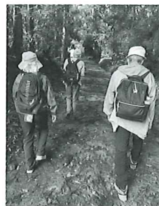
※幸の町づくりサポーターは住民ボランティア活動グループです。