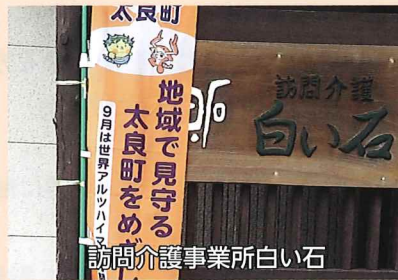
訪問介護事業所 白い石