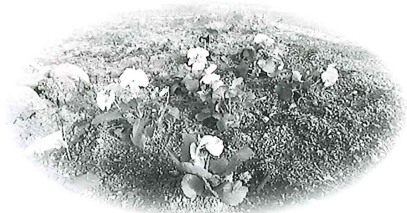
▲しおさい館花壇の花植え

新しい愛称は『いきいき倶楽部』!やりたいことを皆で考えて積極的に身体を動かし、脳トレも頑張ることで生活に張りができる素敵な場所です。笑顔が絶えない、いきいき倶楽部にあなたも仲間入りしませんか?