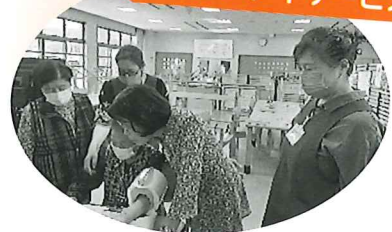
生きがいデイサービス