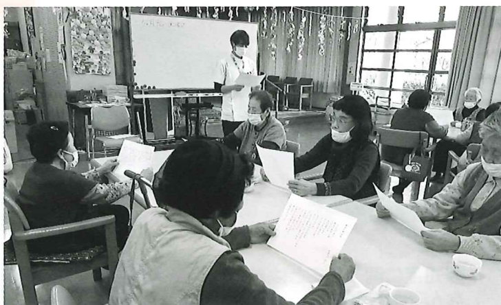
▲毎月太良病院からリハビリ・脳トレ指導に来られます

【利用対象者】 概ね60歳以上の日常生活が自立している元気な方で、独り暮らしや夫婦のみの世帯、もしくは移動手段がなく家に閉じこもりがちの方。 【利用料金】 1回につき700円 (入館料・食事代・おやつ代)