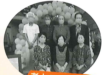
老人クラブ連合会