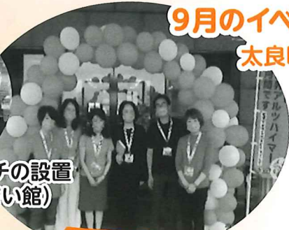
地域包括支援センター