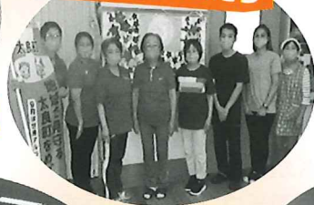
ぬくもいホームたら