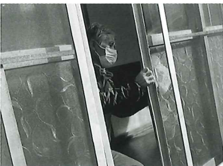
【年末窓ガラス拭き活動】 (主催:ご縁クラブ)

社会福祉協議会では主にお一人暮らしの高齢者に明るいお正月を迎えていただけるよう、 地域の民生委員児童委員やボランティアと一緒に歳末支え合い活動を行っています。