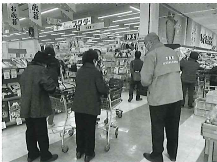
【年末買い物ツアーとあったかプレゼント】 (主催:太良町民生委員児童委員)