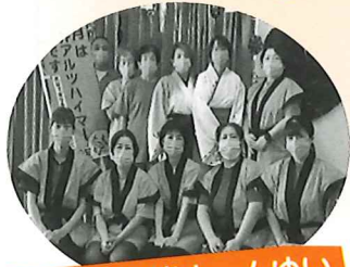
小規模多機能ホームゆい