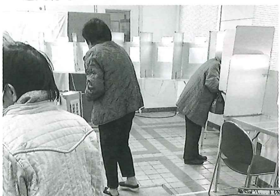
▲役場へ期日前投票に行きました