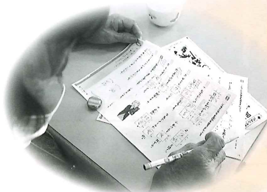
▲脳トレ問題に挑戦中!