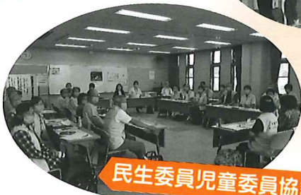
民生委員児童委員協議会