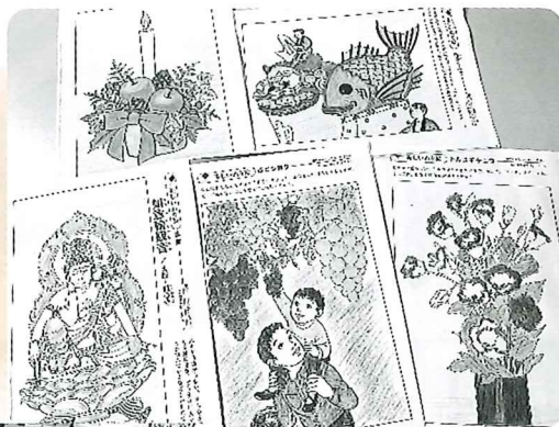
▲力作ぞろいの塗り絵が並びます