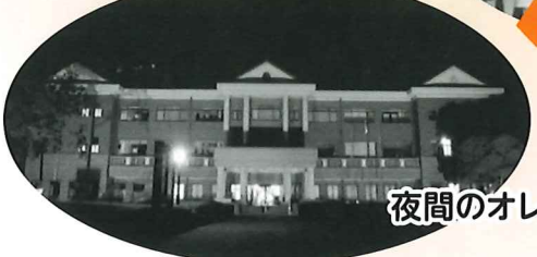
夜間のオレンジライトアップ