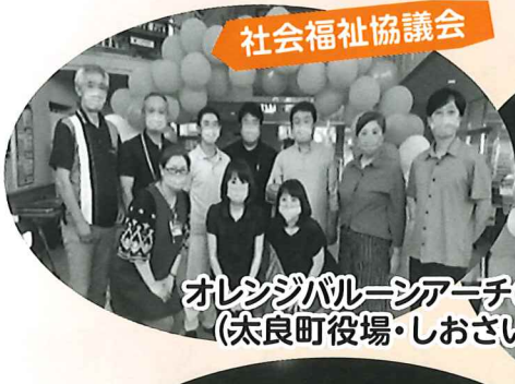
オレンジバルーンアーチの設置 (太良町役場・しおさい館)