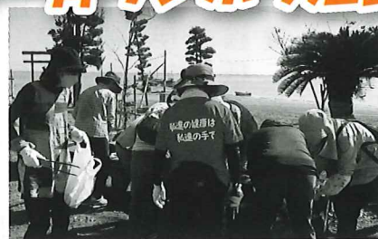
▲海中鳥居付近のゴミを拾いました

10月15日(土)に、町内道路のゴミ拾いや、近所の高齢者への声掛け活動など、それぞれの会員がボランティア活動を1つを行いました。