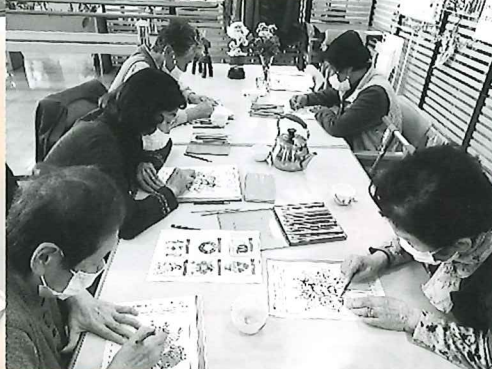
◀塗り絵は人気の趣味活動です